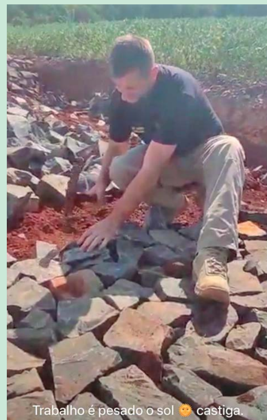
Trabalho é pesado o sol castiga.