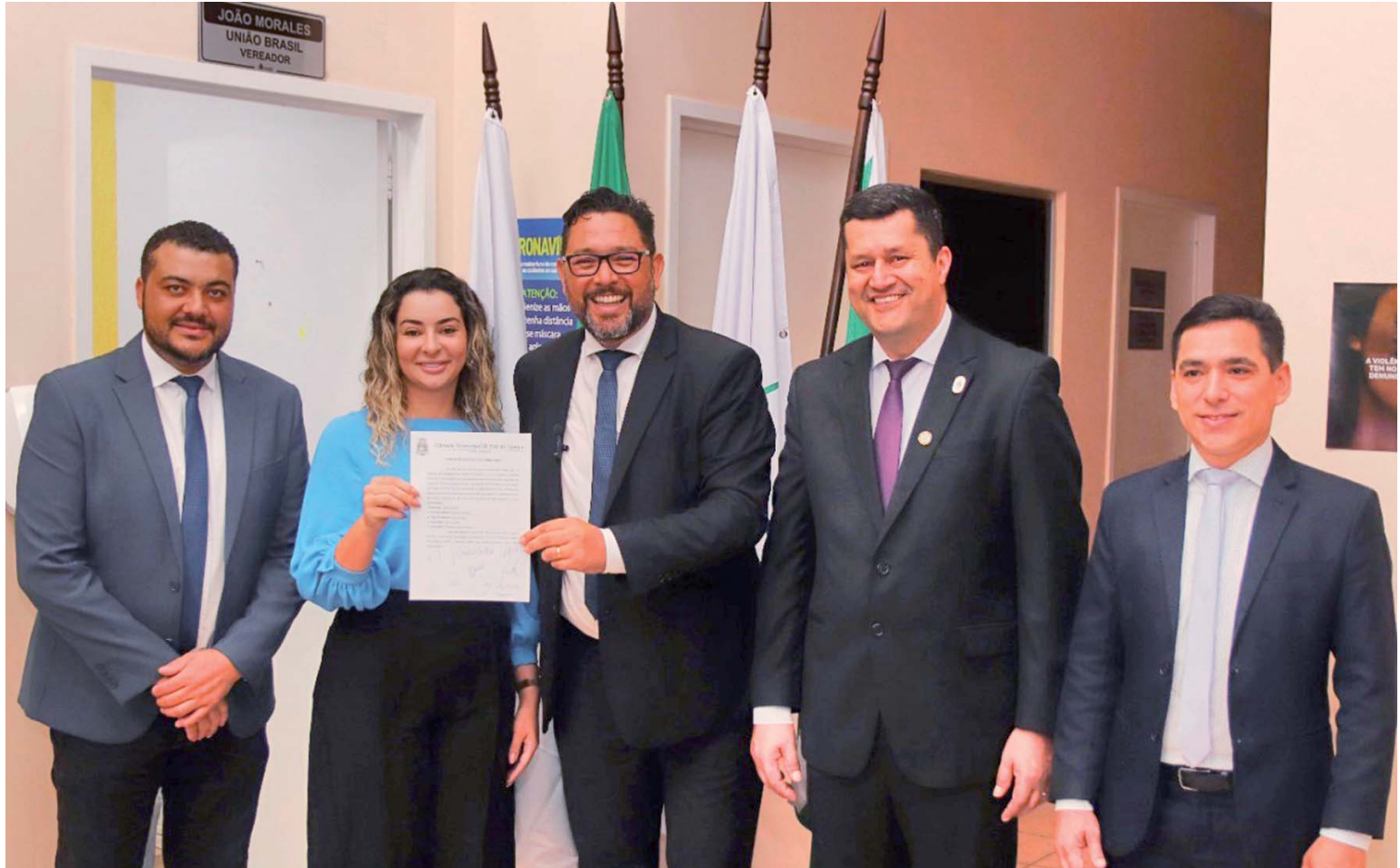
Nova mesa diretora da Câmara: O que mais vai acontecer?

apagar das luzes de cada sessão, uma nova vergonha se acenderá na forma mais traiçoeira da política. Alguns ci-