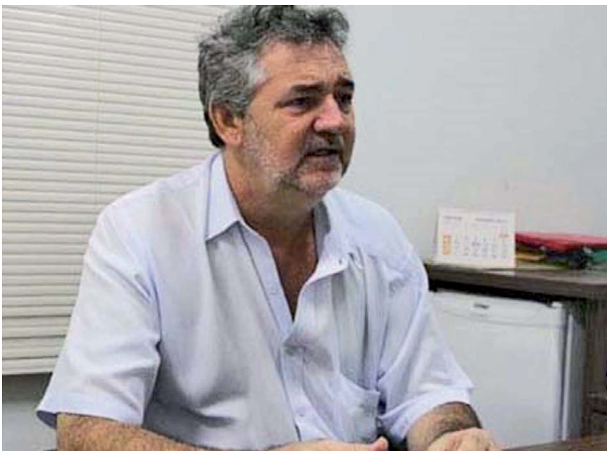
Vitorassi faz o que sempre fez: tumultuar o transporte coletivo

A empresa cumpre rigorosamente com o acordo coletivo pactuado com o Sindicato.