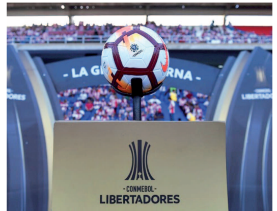
Bola oficial da competição

No último dia (4), começou a fase de grupos da Libertadores da América, sete brasileiros entraram em campo, destaques para as vitórias do Corinthians no Uruguai e do Fluminense no Peru. As zebras passearam pelos campos, o Flamengo perdeu no Equador para o estreante Aucas, e o Palmeiras jogando com os reservas também foi derrotado pelo Bolívar, ambos fora de casa. O Atlético-MG perdeu em casa para o Libertad do Paraguai, o Internacional e o Athletico-Pr ficaram no empate, também fora, na Colômbia e no Peru.