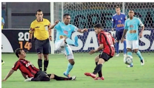
Sporting Cristal recordista em eliminação na fase de grupos