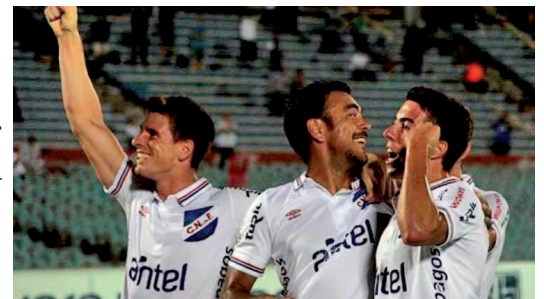
Nacional recordista em participações em Libertadores