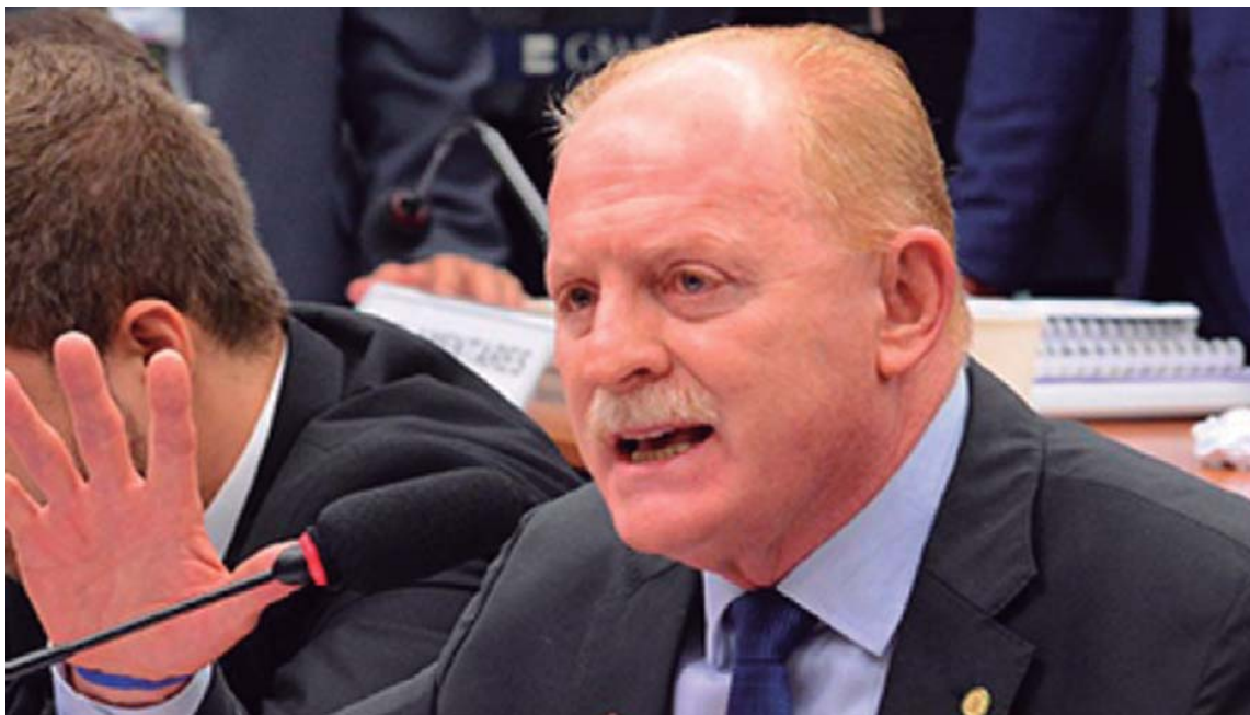
Vermelho quer mudanças radicais no Projeto das Fake News

Para o parlamentar, o texto trata de forma branda o combate à desinfor-