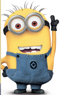
João "Gru" meu presidente malvado favorito