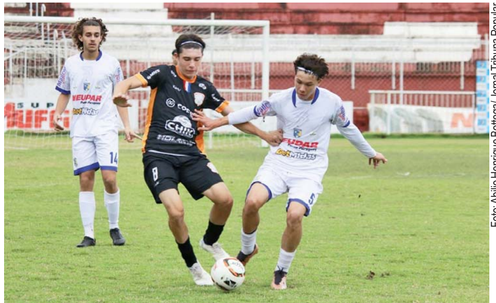
Vitória do Sub 17, por 1x0 no ABC contra o Laranja Mecânica