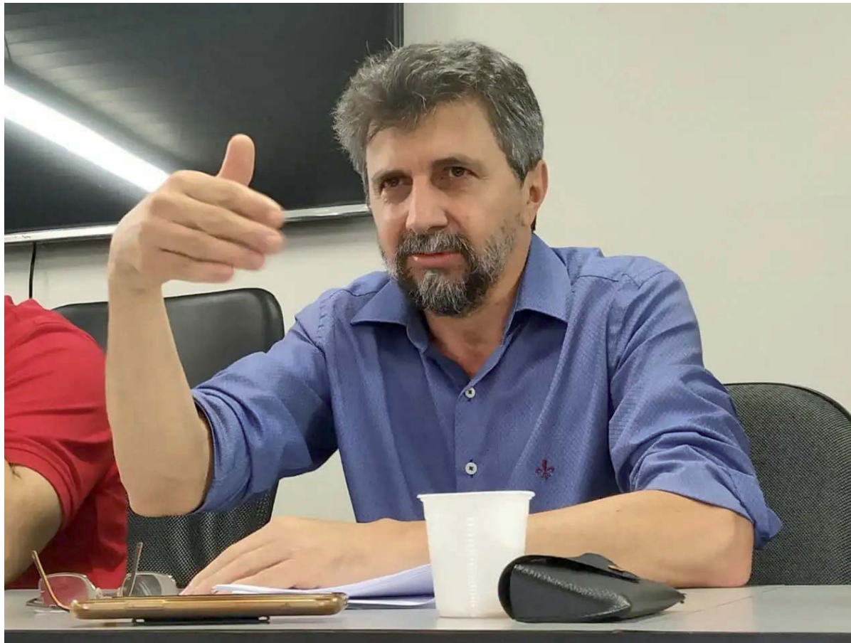
O braço direito do prefeito foi defenestrado pelos internautas e muitas lideranças políticas e empresarias também caíram de pau em cima dele