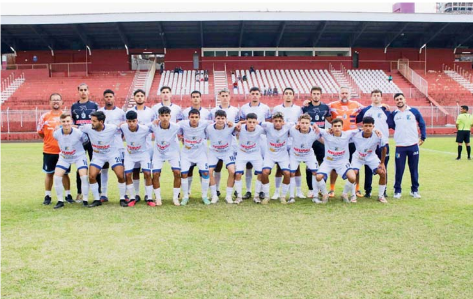
Elenco do Sub 20, em jogo no estádio do ABC