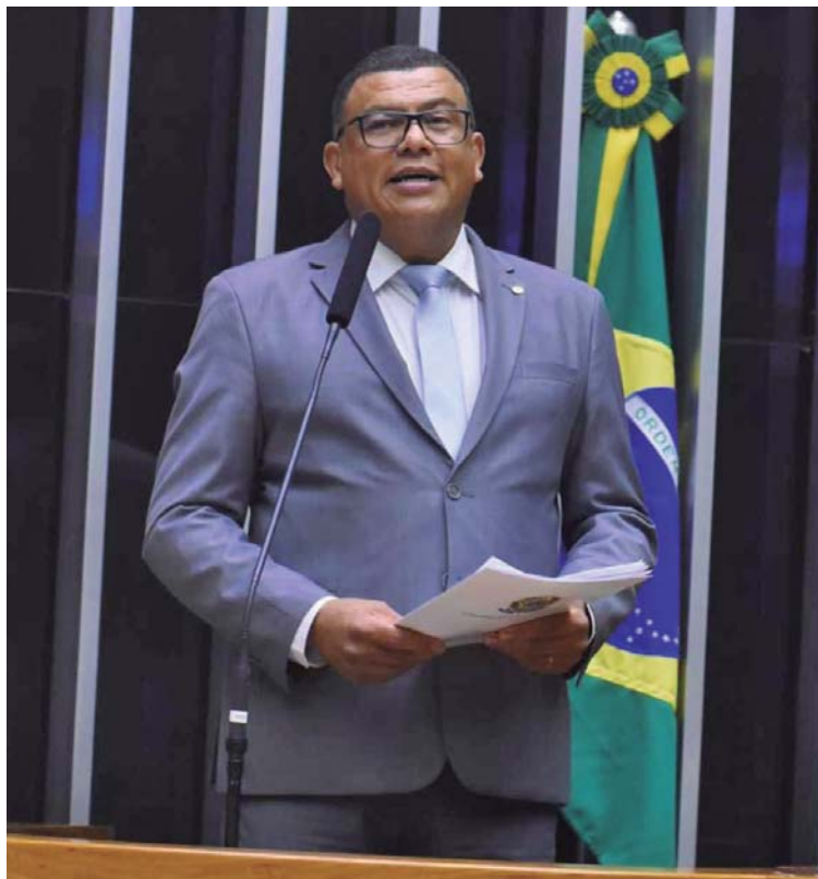
Deputado federal Luciano Alves (PSD) apresentou na Câmara dos Deputados, em Brasília, o Projeto de Lei nº 3950/23

Na avaliação de Luciano, a medida se faz necessária para corrigir o que considera uma injustiça com os condutores. "Todos estão sujeitos a imprevistos, como ter que desembarcar uma gestante prestes a dar à luz ou um paciente socorrido em caso de emergência. A punição com a aplicação de multa é suficientemente pesada para aqueles que permanecem além do tempo na vaga do estacionamento rotativo, ou ainda que não fizeram uso do instrumento de pagamento", justifica o deputado.