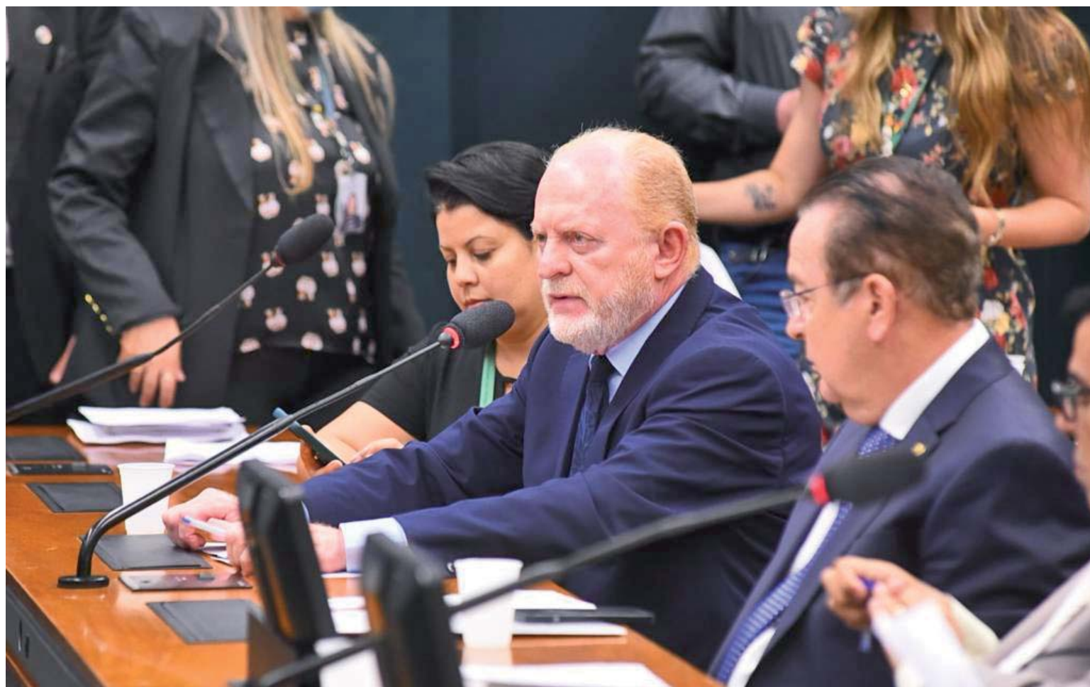
Vermelho defendeu os condutores de ambulâncias e o projeto foi aprovado na Comissão de Trabalho

Para Vermelho, os condutores de ambulâncias fazem