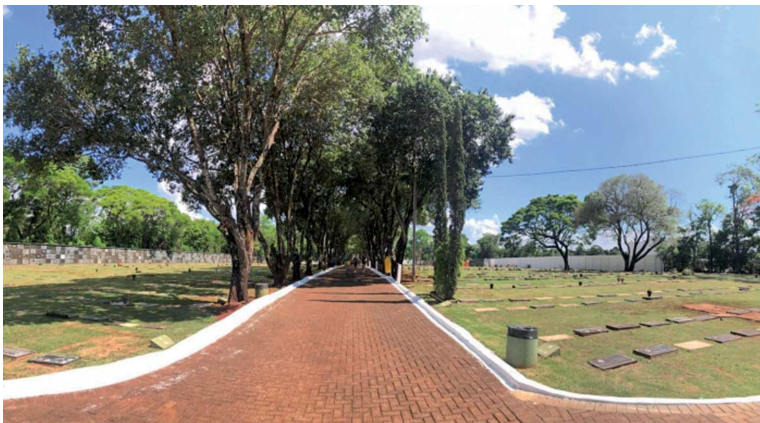
Cemitério do Jardim São Paulo, onde estão desenterrando os corpos

Ao falar sobre essa taxa de R$ 119 reais, Santiago foi ainda mais frio e mercantilista: "O que é R$ 119 reais por ano? Menos que uma cerveja por mês, questionou o ambicioso empresário, esquecendo-se que para algumas famílias esse valor representa o consumo de alimentos por uma semana. Mas, para ele que vive em berço de ouro, R$119 reais é dinheiro de cerveja.