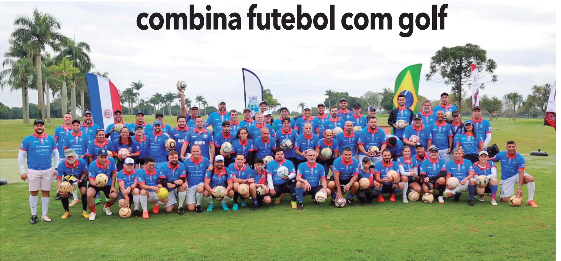
Prática do novo esporte na fronteira