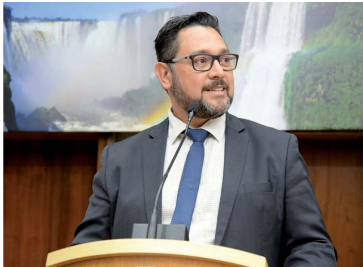
Morales tem sido vítima de seguidas investidas rasteiras e cretinas do grupo de Chico Brasileiro

"Estamos conversando a respeito, e de maneira informal, falando, inclusive, sobre quem poderia contribuir, por exemplo, as entidades como o Observatório Social e OAB, bem como Ministério Público e Tribunal de Contas", disse o presidente da CPI, vereador Galhardo, reforçando que os membros aguardam as deliberações para iniciar oficialmente as investigações. "Vamos dar total transparência com transmissão ao vivo dos trabalhos, dando ciência à sociedade desta ação em que o nosso objetivo é apurar fatos",