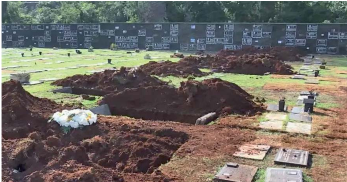
O desmatamento para ampliar o espaço do cemitério foi embargado