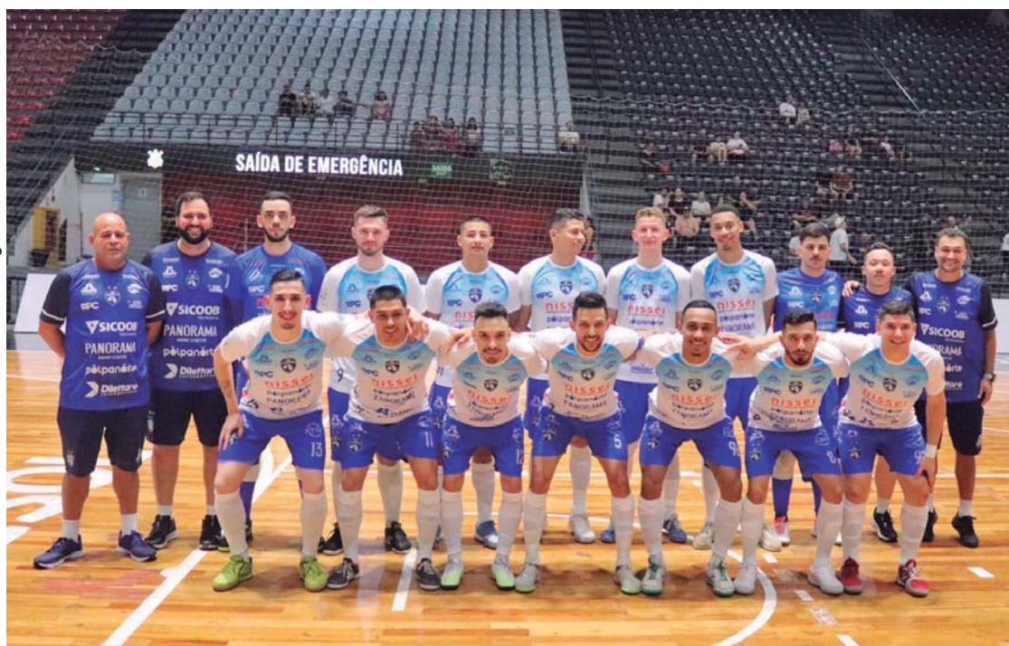
Elenco antes da partida em São Paulo