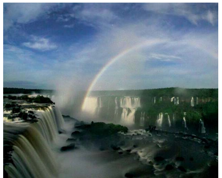
Noite nas Cataratas