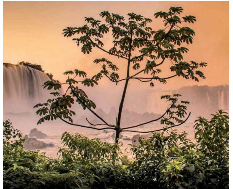
Amanhecer nas Cataratas

www.cataratasdoiguacu.com.br contato@catarataspni.com.br Telefone: +55 (45) 3521-4400