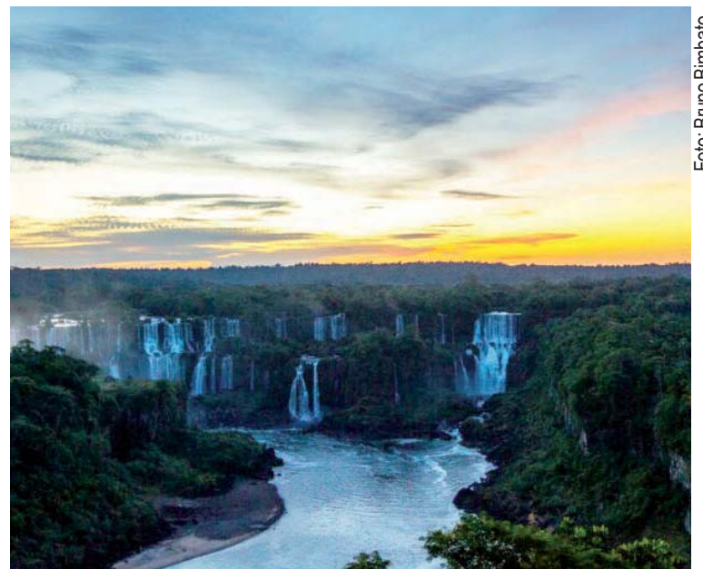
Pôr do Sol nas Cataratas