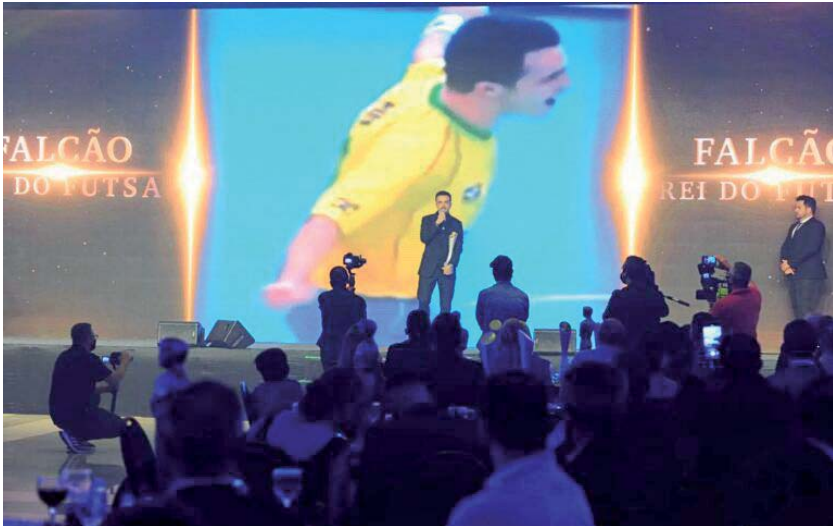
Falcão recebendo a premiação em edições passadas

Foz de Iguaçu será palco da aguardada premiação Gala Mundo do Futsal de 2023. O evento chega a sua terceira edição, e neste ano acontecerá durante o Mundo do Futsal Decathlon Experience, o maior congresso dedicado à modalidade do planeta. A noite promete ser memorável para as estrelas do futsal, que recebem o merecido reconhecimento por suas conquistas na temporada.