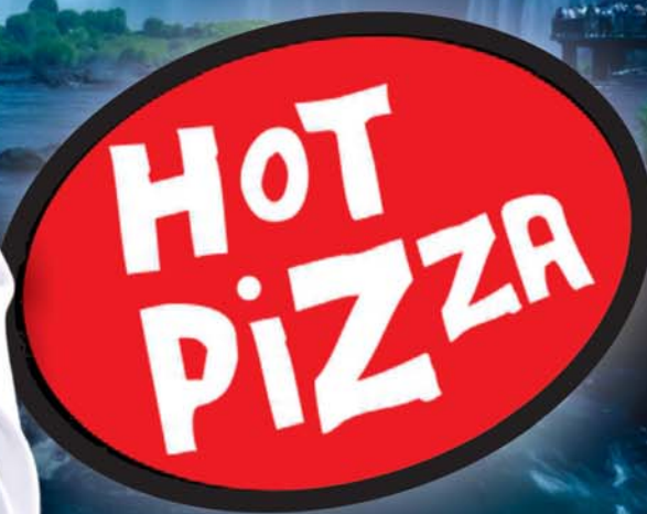
Elvis Pereira e a família Hot Pizza