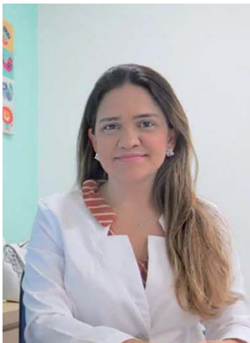
Farta documentação comprova que passaram a mão na cabeça da sobrinha do prefeito