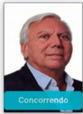
PAULO MAC DONALD

Prefeito - Foz Do Iguaçu/ PR Progressistas - PP 56.757.283/0001-75