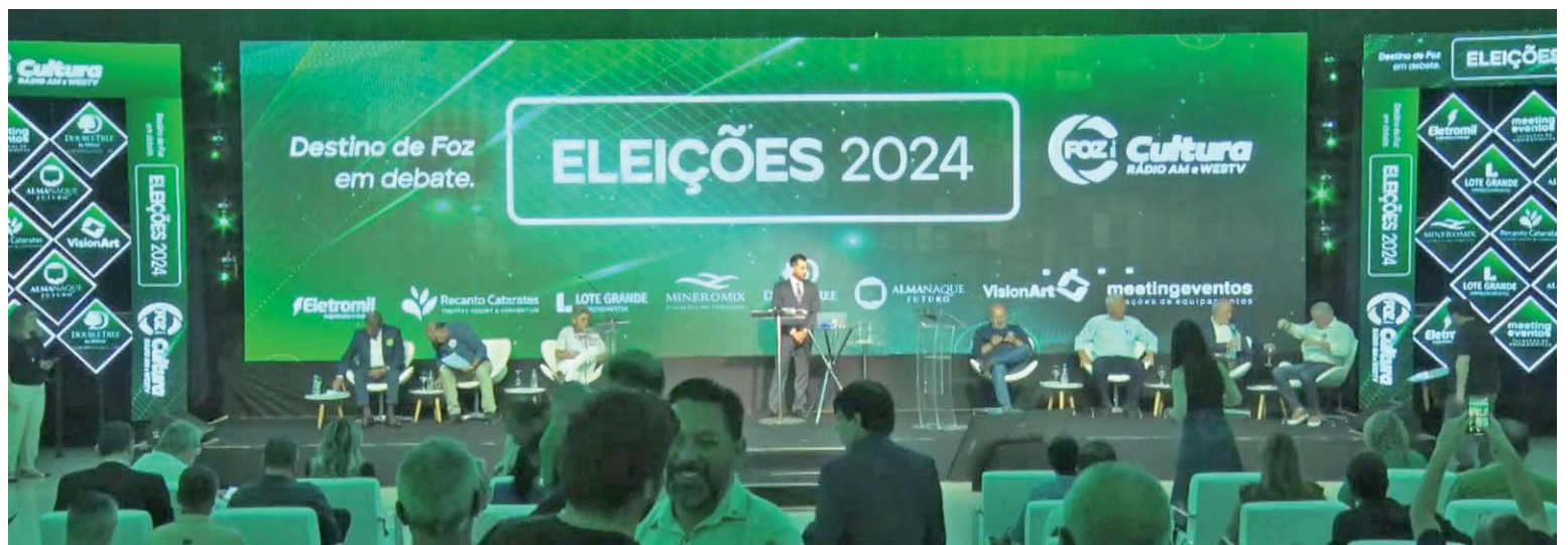
Candidatos fizeram duras críticas a Ratinho e Silva e Luna

Sérgio Caimi foi o primeiro a atacar, mencionando obras como a Ponte da Integração, a Perimetral Leste e a duplicação da Rodovia das Cataratas. Ele afirmou que, embora o governador e seus aliados, como o general Silva e Luna, reivindicam essas obras como conquistas próprias, os projetos são mal geridos, com diversos atrasos e