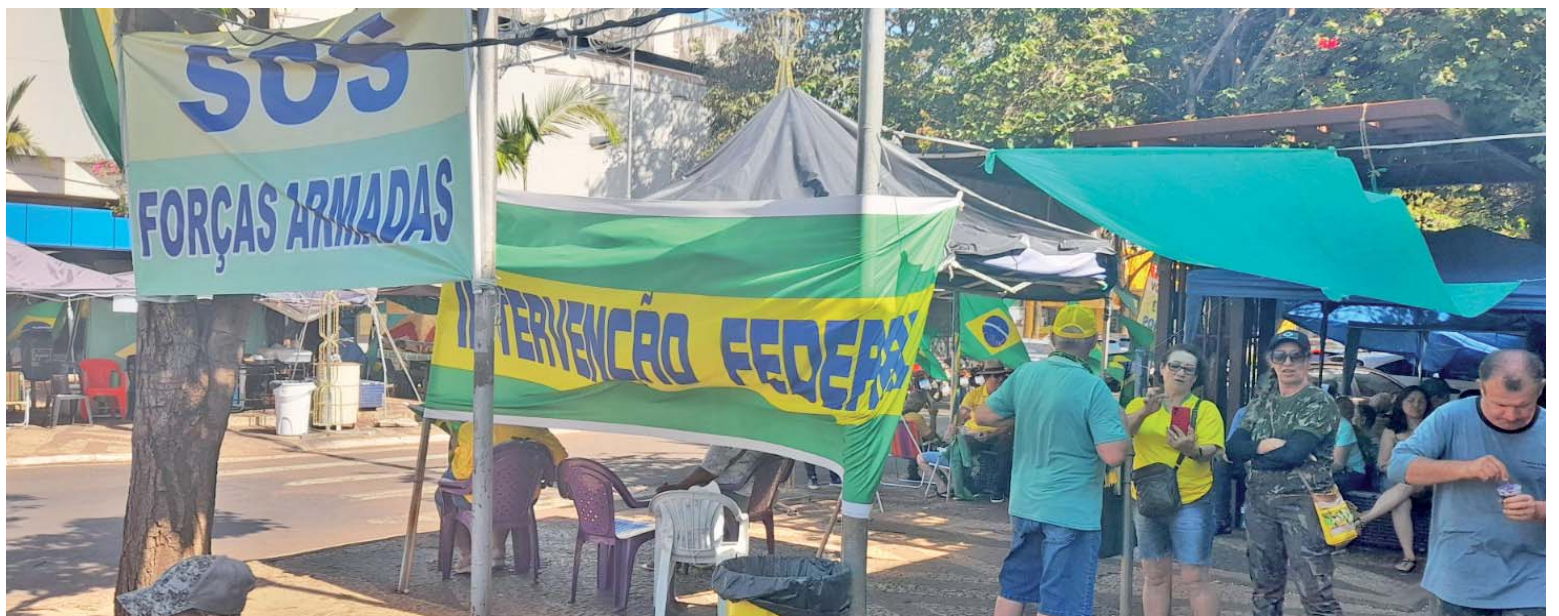
Bolsonaristas acreditam em mula sem cabeça, Saci-pererê e que tudo faz parte de um "grande plano"

Nessa trama que faria injeção aos roteiristas de Hollywood, os "patriotas" acreditam que, em janeiro, Trump finalmente revelará o conteúdo místico de um pendrive levado ao Catar pelo filho de Bolsonaro. Segundo eles, o dispositivo contém provas definitivas de um complô global contra a direita. Mais audaciosos cantam em coro: "O Trump descerá de uma estrela colorida, brilhante... impávido como Mohamed Ali, tranquilo e infalível como Bruce Lee". Milton Nascimento, coitado, provavelmente nunca imaginou sua música adaptada para tal delírio.