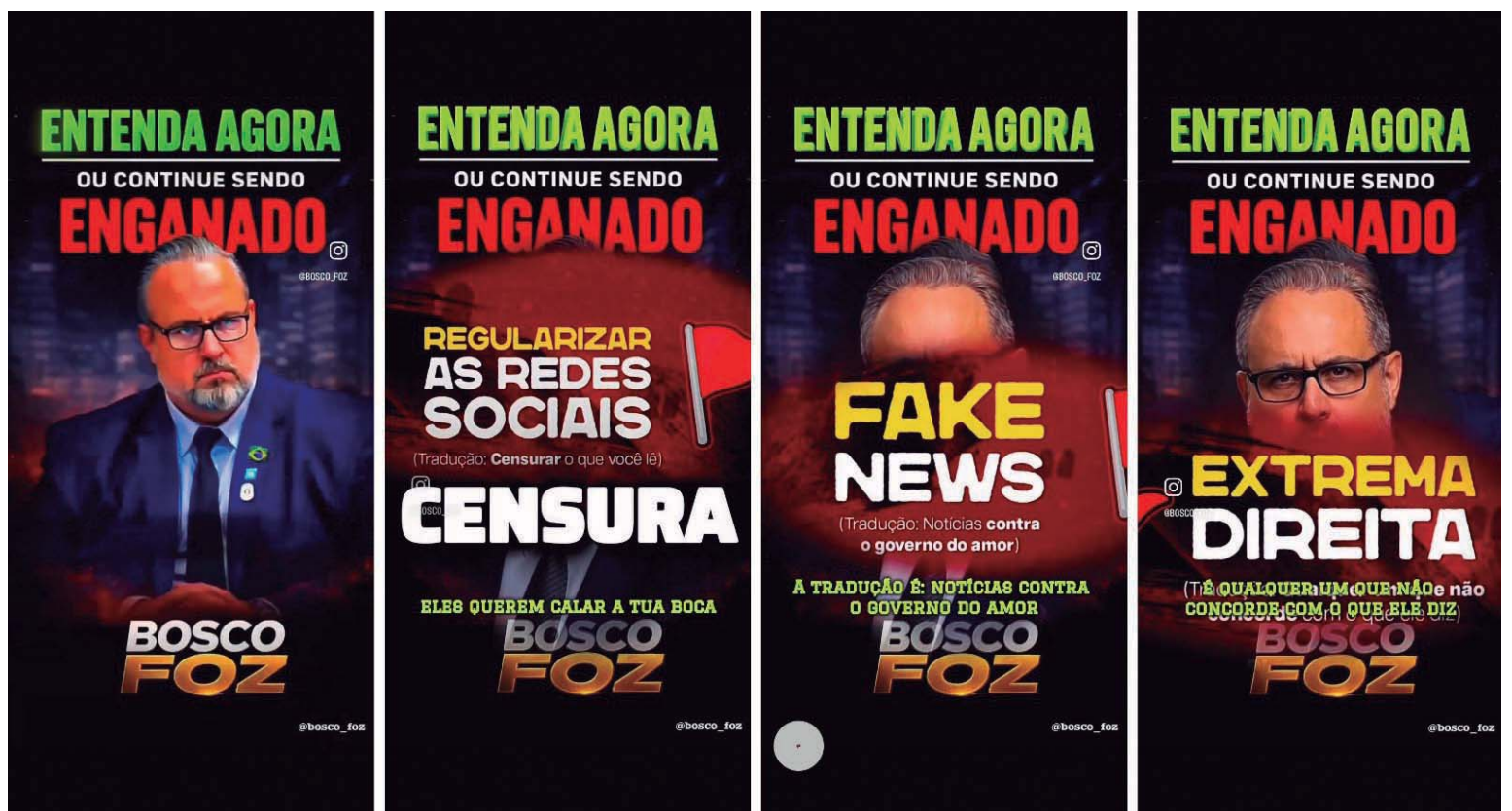
Vídeos equivocados do vereador