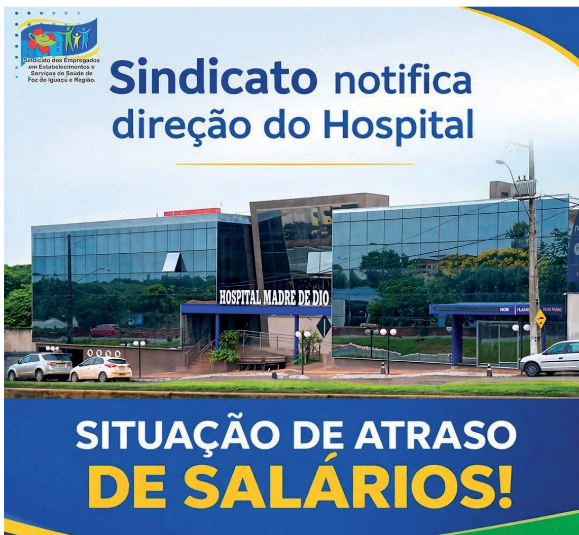
Sindicato notifica direção do Hospital Madre de Dio

E quando se imagina que o fundo do poço chegou, a gestão encontra uma pá. A moda agora atende pelo elegante nome de "Pessoa Jurídica", o famoso PJ, aplicado com uma criatividade que faria corar qualquer departamento jurídico minimamente sério. Na prática, o que se vê é a velha ten-