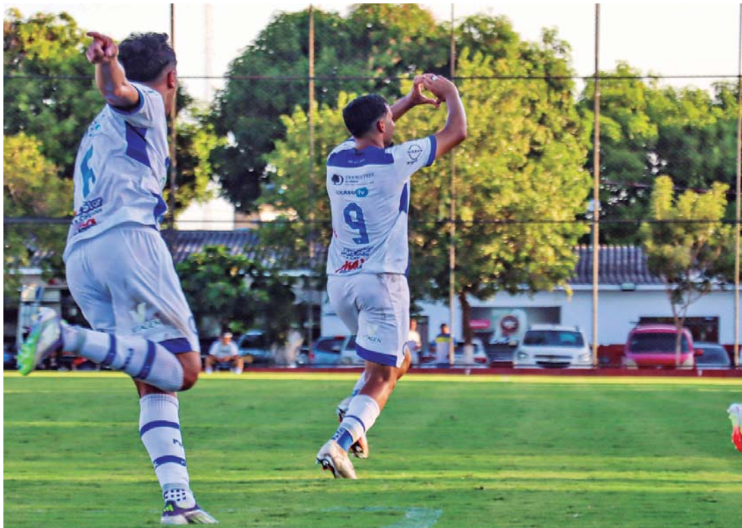
Equipe fez o dever de casa no campo do Flamengo

car a classificação fora de casa", concluiu.